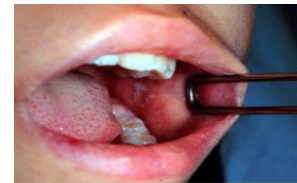
コプリック斑