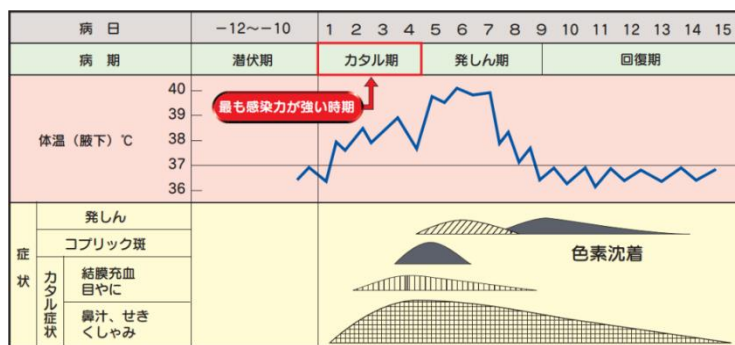
藤井良知、西村忠史、中村健：小児感染症学、第1版、南山堂、東京、1985、pp.14より改変